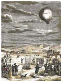
Zeitgenössische Darstellung des ersten Ballonaufstieges am 4. Juni 1783 im französischen Annonay.

Ballonfahren ist die älteste und ursprünglichste Art und Weise, mit der sich die Menschen in die Luft erheben. Vor mehr als 200 Jahren stieg der erste Ballon in Annonay in Frankreich auf. Joseph und Étienne Montgolfier demonstrierten dort zum ersten Mal der Öffentlichkeit und Ständeversammlung ihr Modell Nr. 4, welches bei der Freifahrt eine Strecke von zwei Kilometern zurück legte. Hatten Heißluftballone noch zu Pionierzeiten Vorrang, erhielten diese bald von Gasballonen ernst zu nehmende Konkurrenz. Eine Renaissance erlebten die „Heißlüftler“ Mitte des vergangenen Jahrhunderts und seitdem stellen sie die Mehrzahl der Ballone.